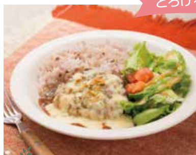
とろけるチーズが旨っ!