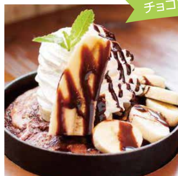
チョコ×バナナの鉄板コラボ